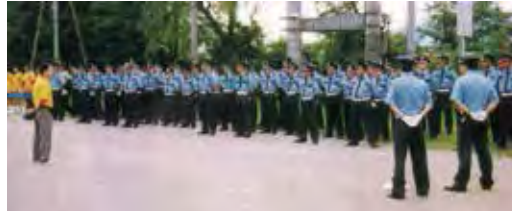
●大型イベント前の合同研修