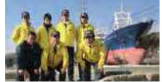
●被災した店舗の警備、宮城県気仙沼へ