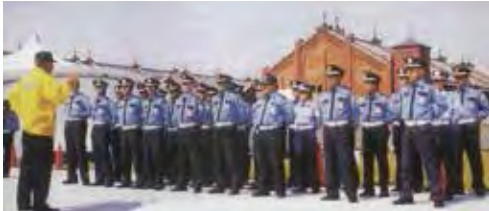
●横浜赤レンガ倉庫、MMでの警備開始