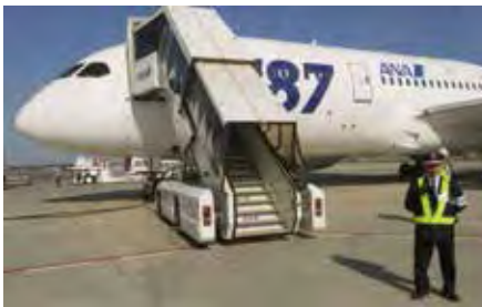
●羽田・成田・千歳・関空・伊丹・福岡・那覇・松山での空港関係警備2,200人が担当