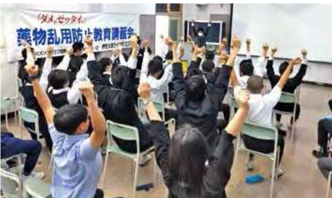
●第一中学校講習会