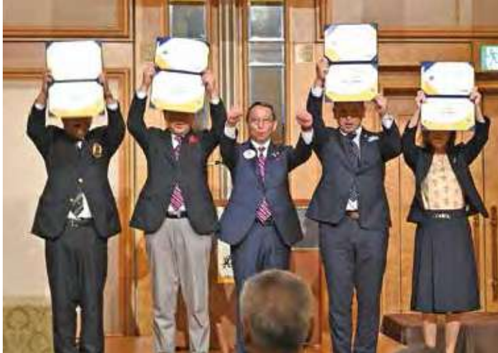
●国際会長感謝状・地区ガバナー感謝状が授与された