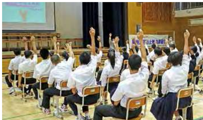
●第二中学校講習会