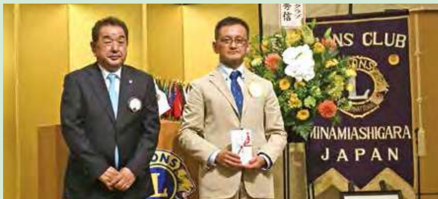
●スポンサークラブ小田原LC 白川会長(右)