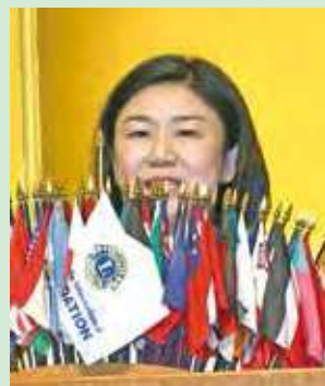
●祝辞を述べる衆議院議員 牧島様