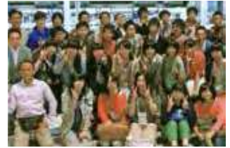
●大船渡(岩手県)の復興支援の催し