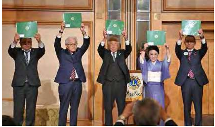
●LCIF2022～2023 国際会長感謝状を授与されたメンバー