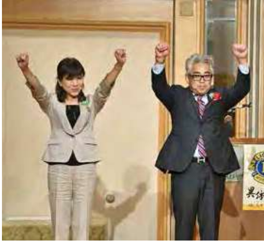
●国際会長賞受賞者