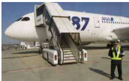
●羽田・成田・千歳・関空・伊丹・福岡・那覇・松山での空港関係警備2,200人が担当