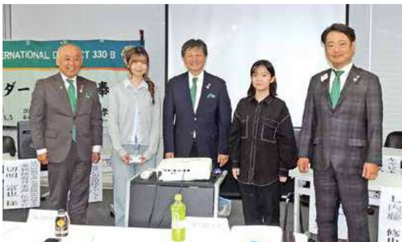
●大学生2名も受講に参加(神奈川会場)

今年も「薬物乱用防止教育認定講師養成講座」が10月8日(水)に横浜市のBelle関内601で、11月13日(木)に山梨県男女共同参画推進センターぴゅあ総合大研修室にて開催された。神奈川は大学生2名を含む約80名が受講、山梨も2名の大学生と大勢のライオンが受講した。