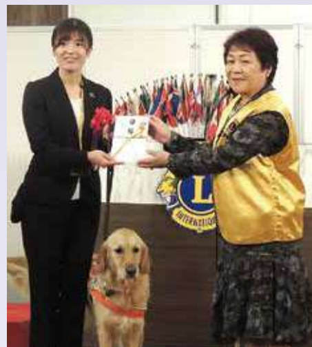
●(公財)日本盲導犬協会へ金一封