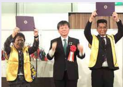
●清水会長(左)と直井実行委員長に国際会長アワードが贈られた