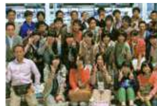
●大船渡（岩手県）の復興支援の催し