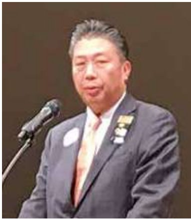
●倉田330複合地区ガバナー協議会議長