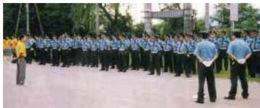
●大型イベント前の合同研修