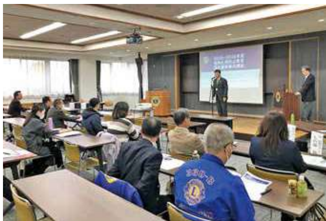
●山梨会場 男女共同参画推進センター

主催：ライオンズクラブ国際協会 330-B 地区、(公財) 麻薬・覚せい剤乱用防止センター 後援：厚生労働省、文部科学省、警察庁、こども家庭庁