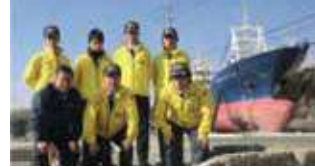
●被災した店舗の警備、宮城県気仙沼へ