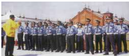
●横浜赤レンガ倉庫、MMでの警備開始