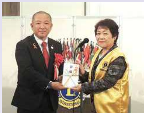
●清水会長から相模原市に金一封 本村賢太郎相模原市長へ進呈