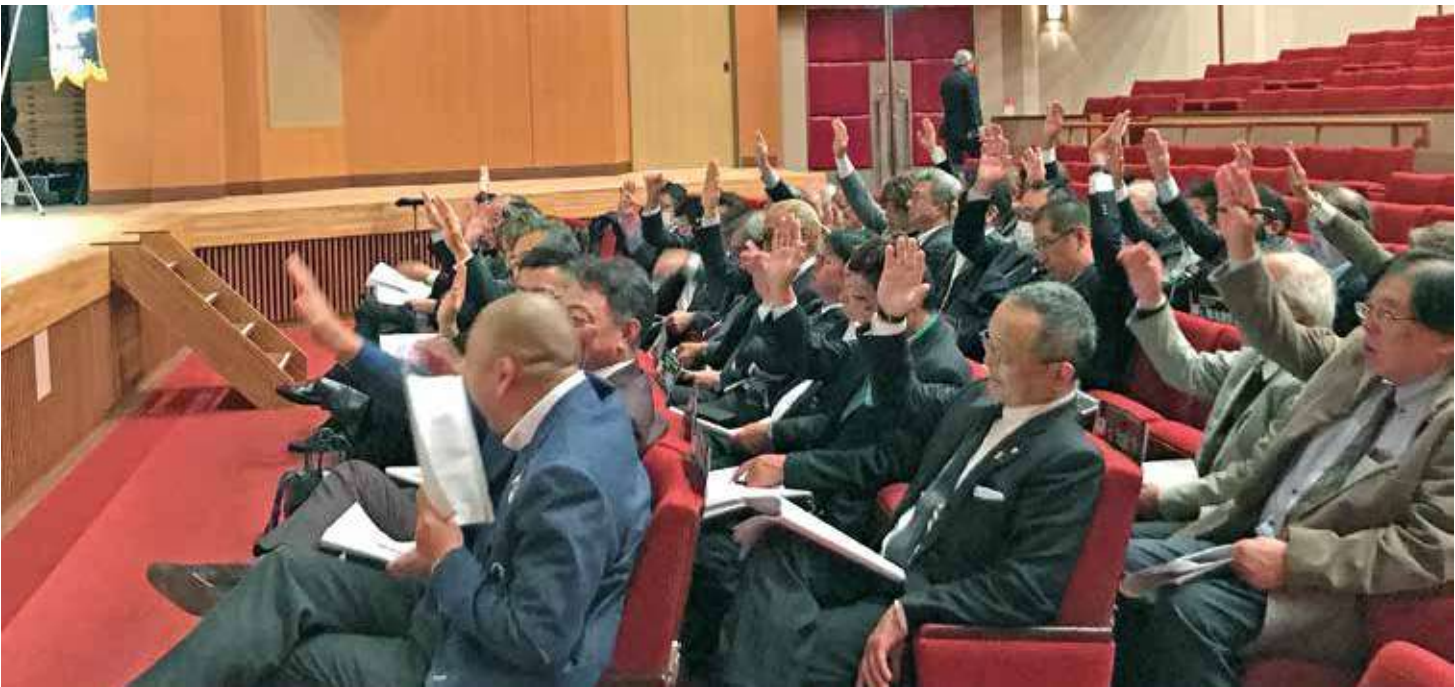
●賛成多数で承認可決