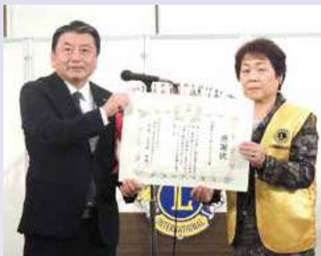
●日本赤十字社へ金一封