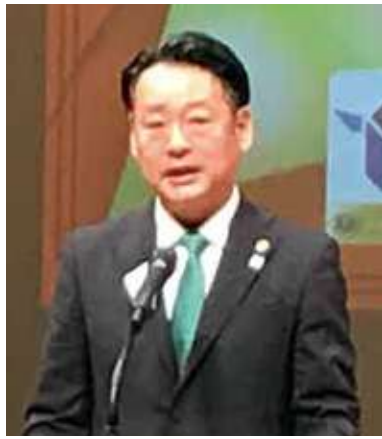
●井田第2副地区ガバナー

地区年次大会議事規則」(資料1)の規定と要綱により実施したいので承認を求めます。