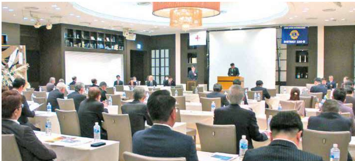
●ベルクラシック甲府会議室

11月13日(木) ベルクラシック甲府で、赤十字血液センターとライオンズクラブの合同会議が開催された。この会議は年に一度開催され、現状の活動報告と今後の取り組みについて意見交換をする。