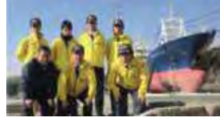
●被災した店舗の警備、宮城県気仙沼へ