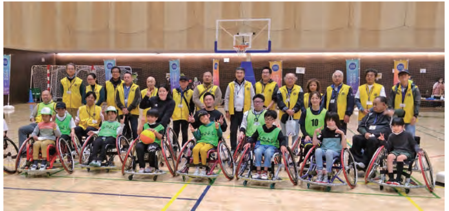
●車椅子バスケット