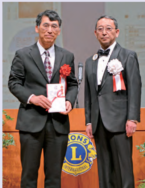
●山梨大学医学部教授 柏木様