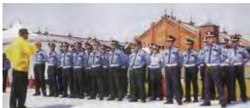
●横浜赤レンガ倉庫、MMでの警備開始