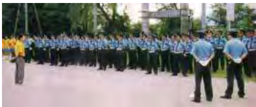
●大型イベント前の合同研修