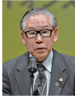
●議事運営について説明する柵形議事運営委員長