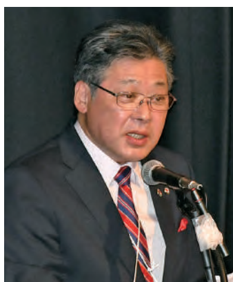
●議案を説明する名執キャビネット幹事