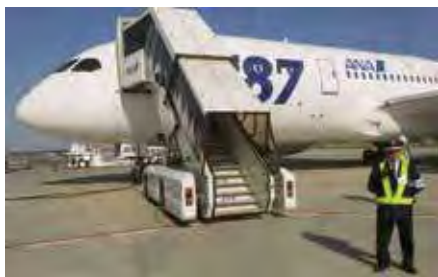
●羽田・成田・千歳・関空・伊丹・福岡・那覇・松山での空港関係警備2,200人が担当