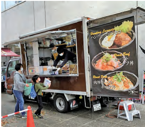
●2種類体験でキッチンカーのランチを無料提供