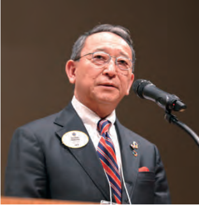
●中澤大会会長の開会宣言