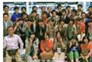
●大船渡(岩手県)の復興支援の催し