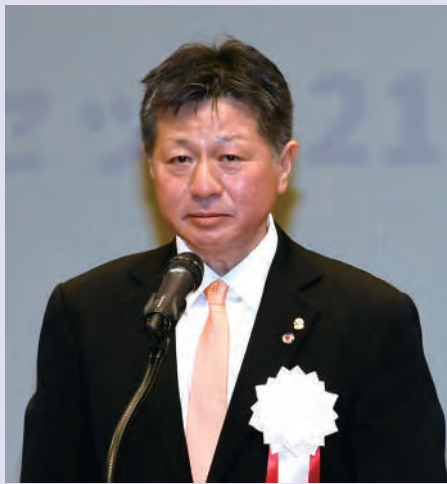
●森川第2副地区ガバナー予定者