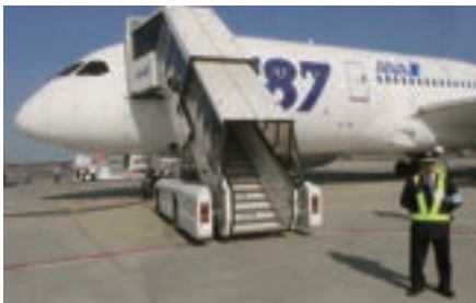
●羽田・成田・千歳・関空・伊丹・福岡・那覇・松山での空港関係警備2,200人が担当