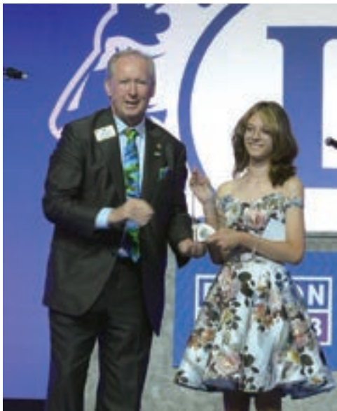
●平和ポスター・コンテスト大賞受賞者