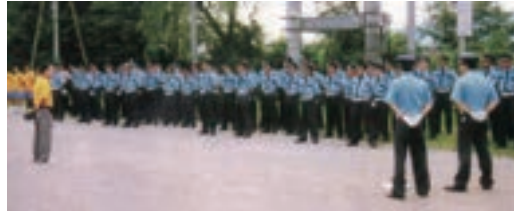
●大型イベント前の合同研修