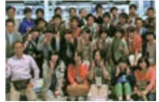
●大船渡(岩手県)の復興支援の催し