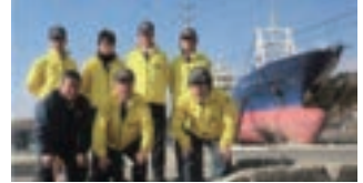
●被災した店舗の警備、宮城県気仙沼へ