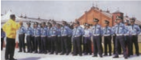
●横浜赤レンガ倉庫、MMでの警備開始