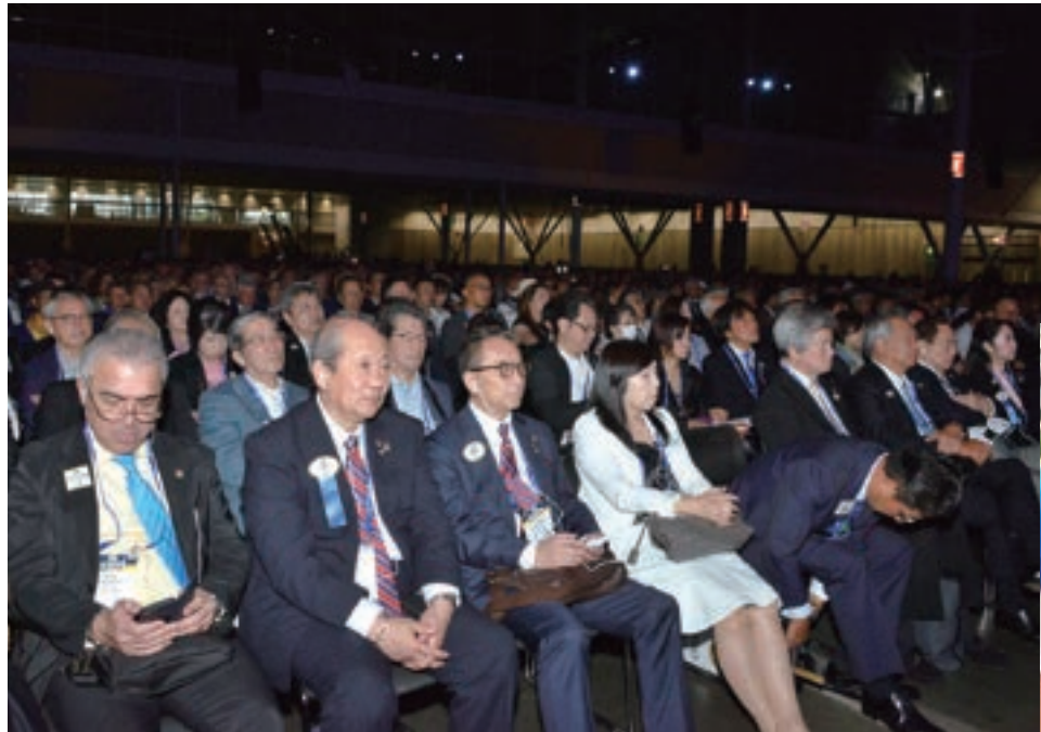
●ボストン・コンベンション・エキシビション・センター

7月7日(金)～11日(火)、アメリカ合衆国マサチューセッツ州ボストンにおいて第105回ライオンズクラブ国際大会が開催された。