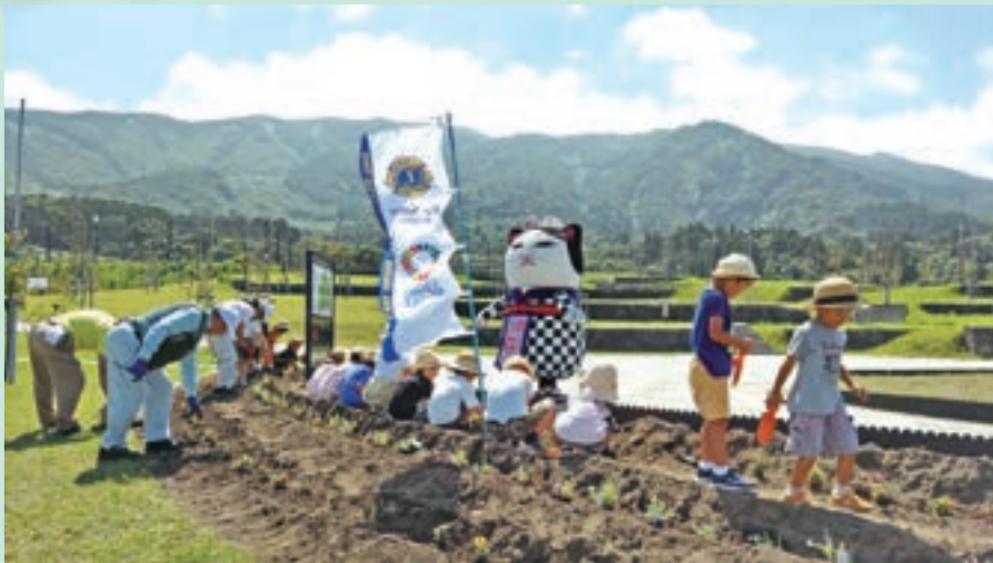
●その1 メモリアル公園 花壇整備