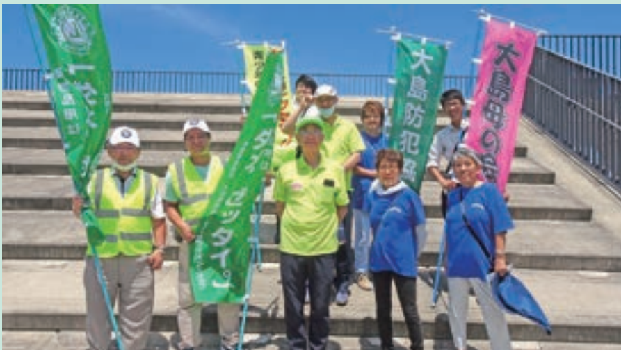
●その3 薬物防止キャンペーン