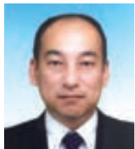
地区ニュース委員会 委員