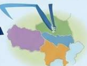
視力プログラムの起源