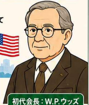
初代会長: W.P. ウッズ